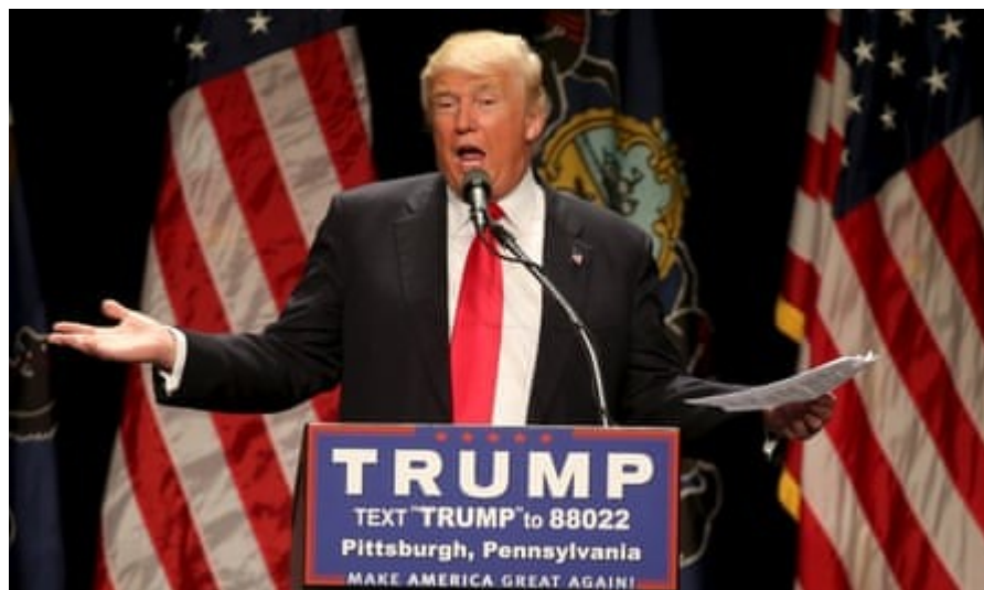
Slogans, Symbole und Sensationen ... Donald Trump.

Die vielleicht gefährlichste Auswirkung des Neoliberalismus sind nicht die von ihm verursachten Wirtschaftskrisen, sondern die politische Krise. Mit der Einschränkung des staatlichen Einflusses schrumpft auch unsere Fähigkeit, unser Leben durch Wahlen zu beeinflussen. Stattdessen, so die neoliberale Theorie, können Menschen ihre Entscheidungen durch Ausgaben treffen. Doch manche haben mehr Geld zum Ausgeben als andere: In der großen Konsum- oder Aktionärsdemokratie sind die Stimmen ungleich verteilt. Die Folge ist eine Entmachtung der Armen und der Mittelschicht. Da Parteien der Rechten und der ehemaligen Linken ähnliche neoliberale Politiken verfolgen, schlägt die Entmachtung in Entrechtung um. Viele Menschen verlieren ihre politische Orientierung.